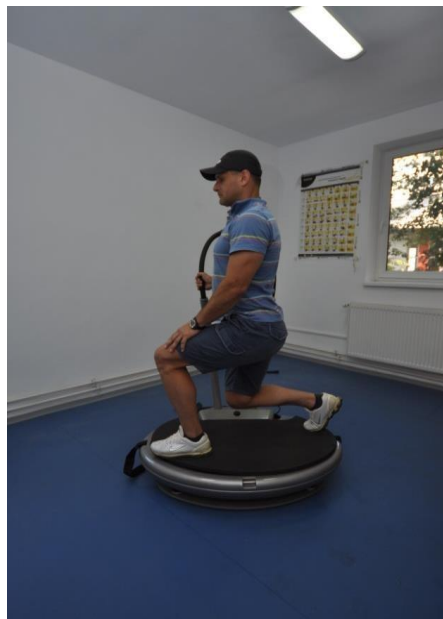
Fig. 1. Titlul figurii